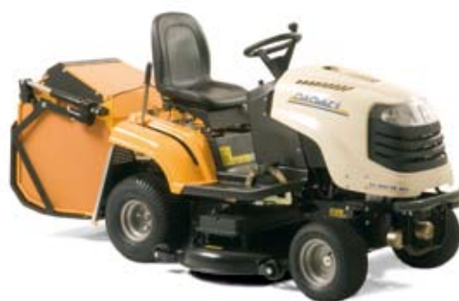
Obrázek s příslušenstvím: pevný sběrný koš s hydraulickým otevíráním a žací ústrojí