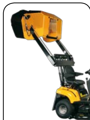
400 l koš s vysokým zdvihem