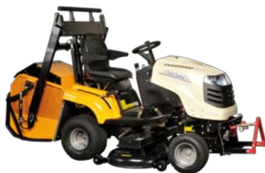
Obrázek s příslušenstvím: pevný sběrný koš s hydraulickým otevíráním a vysokým zdvihem, třibodový závěs a žací ústrojí