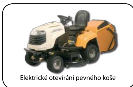
Elektrické otevírání pevného koše