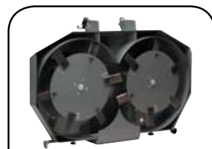
žací ústrojí vhodné i pro vysokou travu a mulčování trávu 3v1 - 102 cm