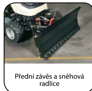
Přední závěs a sněhová radlice