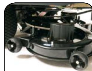
žací ústrojí - 105 cm