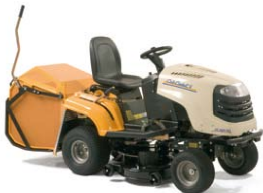
Obrázek s příslušenstvím: pevný sběrný koš a žací ústrojí