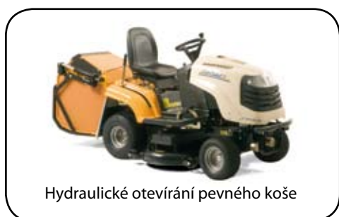
Hydraulické otevírání pevného koše