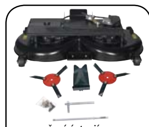
žací ústrojí a mulčovací paket - 122 cm