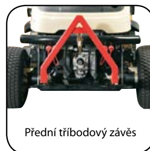
Přední tříbodový závěs