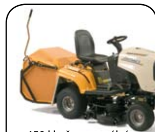
450 l koš s manuálním otevíráním