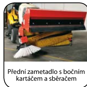
Přední zametadlo s bočním kartáčem a sběračem